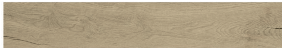
Bricola Naya 20 x 120 (33 вида рисунка)