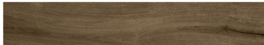
Bricola Miel 20 x 120 (33 вида рисунка)