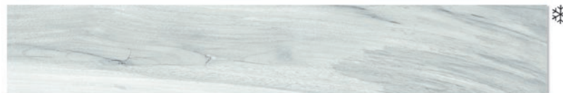
Tasmania Frost 20 x 120 (6 видов рисунка)