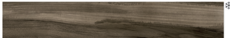
Tasmania Teak 20 x 120 (6 видов рисунка)