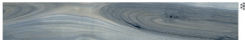
Tasmania Rain 20 x 120 (6 видов рисунка)