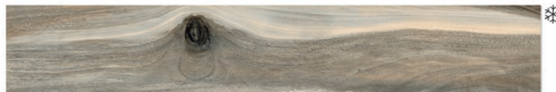
Tasmania Drift 20 x 120 (6 видов рисунка)